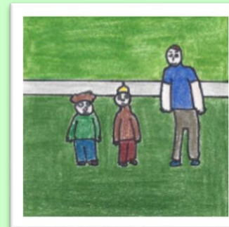
Nicolas rencontre les enfants pour parler des gestes et paroles posés.