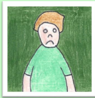
Théo est nouveau à l'école. Il est triste et il a peu d'amis.