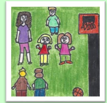
Lors des activités de groupe, personne ne choisit Théo .