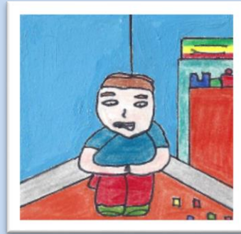
Adam est seul.