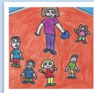
Les enfants jouent au ballon musical.