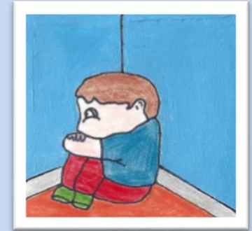
Adam est timide. Il est gêné de se joindre aux amis.